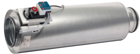
BVAVd-LD VAV med ljuddämpare