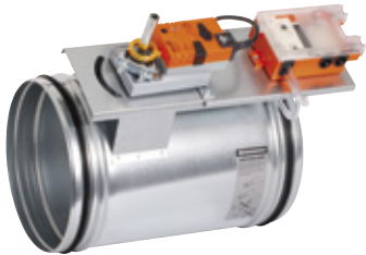
BVAV-1 VAV Universal

Se alla produkter på vår hemsida www.bevent-rasch.se