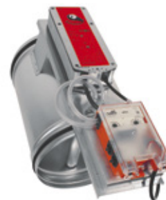
RABC-VAV Kombinerat VAV- och brandgasspjäll