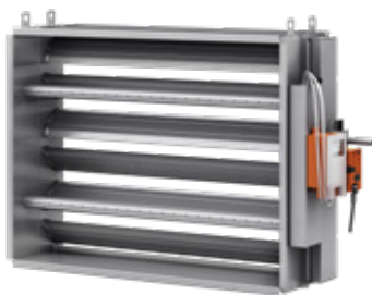
BVAV-3 Variabel-/konstantflödesspjäll med display