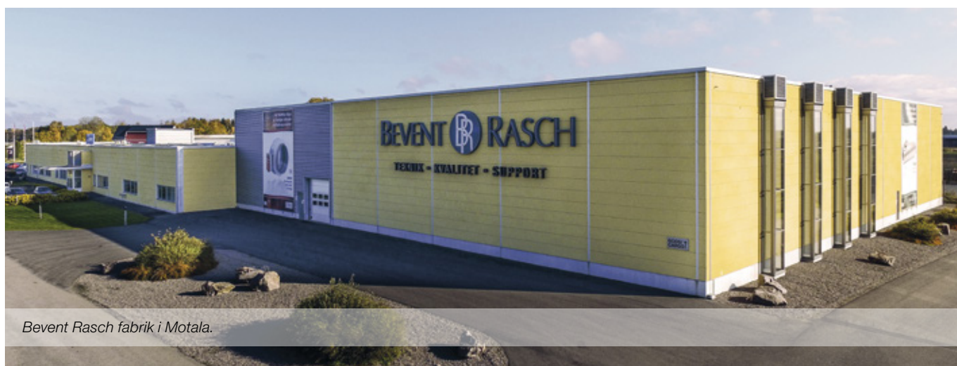
Bevent Rasch fabrik i Motala.

Vi strävar efter att hålla hög teknisk nivå på såväl produkter som personal. Vår tekniska support sköts av våra försäljningskontor i Stockholm och Borås. Här ger vi dig som kund och konsult svar på frågor som rör våra produkter och system.