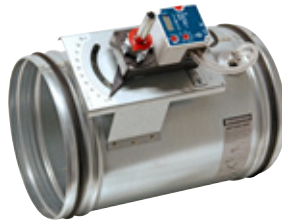
BVAVd Variabel-/konstantflödesspjäll med display