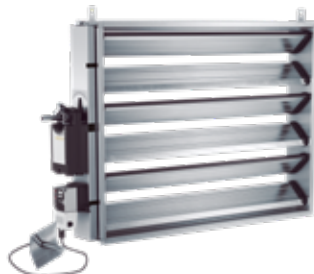
BVAPd-3 Konstant- tryckhållningsspjäll